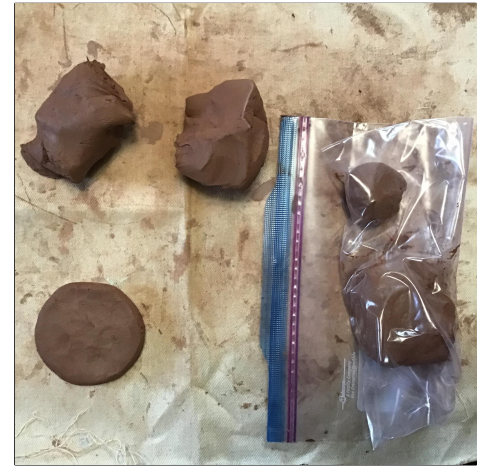
3. Make the bottom : a disc of clay that is 1-1.5 cm thick and 7-10 cm in diameter. Store any leftovers in your bag. 底を作ります: 厚さ1~1.5 cm、直径7~10 cmの粘土の円盤。残ったものはカバンの中に保管してください。