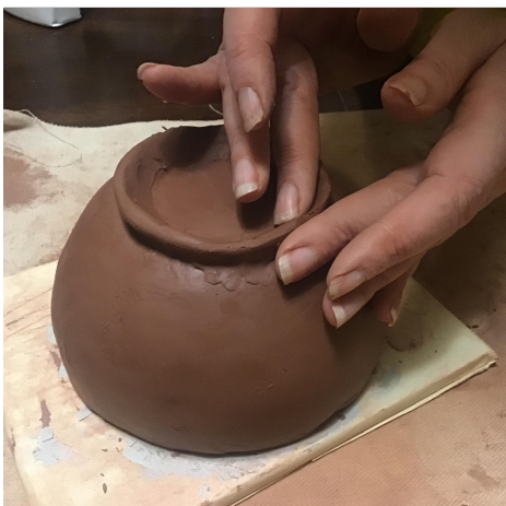
13. Add a foot by attaching a coil. コイルを取り付けて足を追加します。